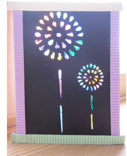
5年 □□ □□ スタンドグラス風切り絵