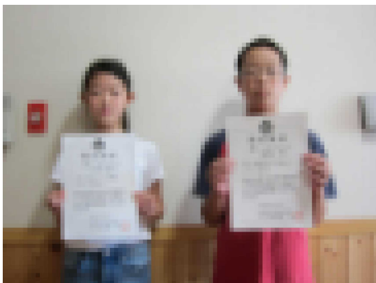
(左) 5年□□□□さん (右) □□ □さん