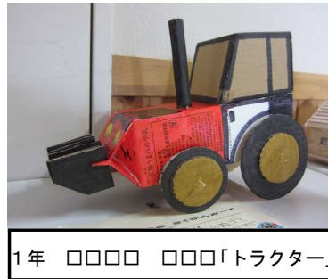
1年 □□□□ □□□「トラクター」