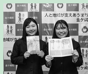
高校生による俳句記念誌作成