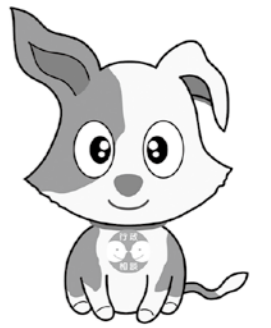
行政相談マスコット 「キクーン」

行政相談委員は、地域の皆さんの身近な相談相手として幅広く困りごとを受け付けています。相談は無料、秘密厳守です。行政に関する困りごとは行政相談委員または「きくみみ岩手」までご相談ください。