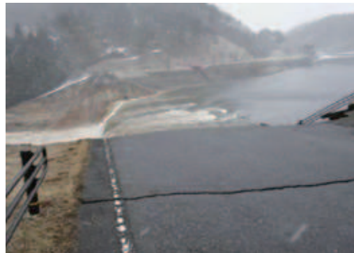
決壊直後の藤沼湖

このハザードマップは、ため池が決壊した場合に想定される浸水区域を予測し地図化しており、皆さんが安全に避難するために必要な情報が記載されています。