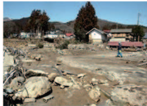
濁流が襲った藤沼湖下流の集落