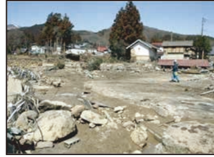
濁流が襲ったため池下流の集落