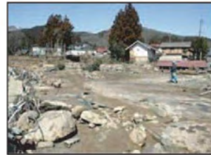
濁流が襲ったため池下流の集落