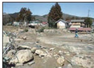
濁流が襲ったため池下流の集落

「ため池ハザードマップ」は、ため池が決壊した場合に想定される浸水区域を図化し、住民の皆さんが安全に避難できるために必要な情報を記載しています。