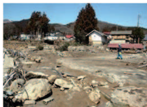
濁流が襲った藤沼湖下流の集落