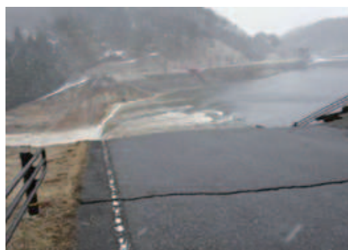
決壊直後の藤沼湖

このハザードマップは、ため池が決壊した場合に想定される浸水区域を予測し地図化しており、皆さんが安全に避難するために必要な情報が記載されています。