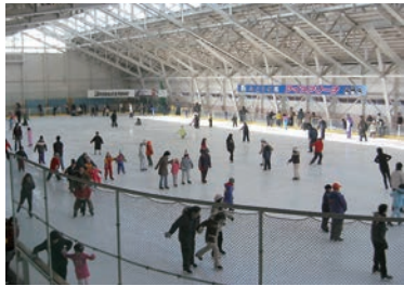
金ケ崎町永栄上宿26-3 TEL 0197-44-2131

SPOT 7 みどりの郷スポーツ施設 温泉のほか、テニスコート、県南最大級の屋内アイスリンク、グランドゴルフ場などスポーツ施設が充実しています。