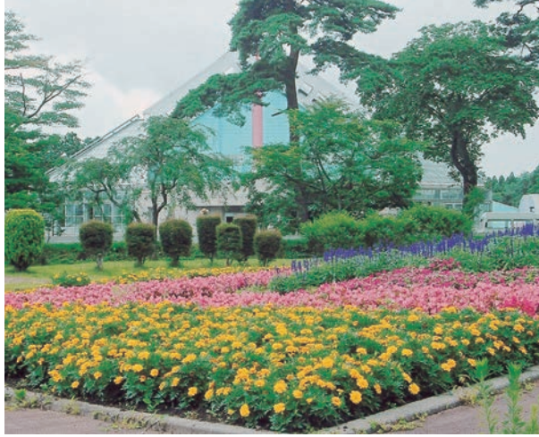
金ケ崎町六原頭無2-1 TEL 0197-43-2107