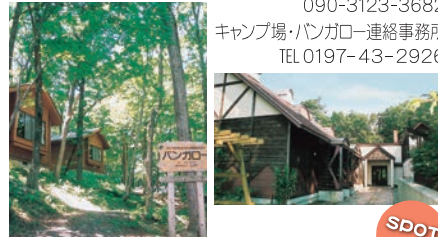
キャンプ場・バンガロー連絡事務所 TEL 0197-43-2926

SPOT 9 せんがんいしりんこうえん 千貫石森林公園 広大な自然の中に整備されたこの公園は、豊かな水をたたえる二つの堤とその周辺の樹林や奥羽山系により四季折々に絶景を見せてくれる癒しの場でもあり、公園内には林間歩道8コース、キャンプ場やバンガローなどの施設があり、アウトドアを楽しむの場にもなっています。