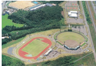
金ケ崎町西根森山31-2 TEL 0197-44-5600

温水プール、アスレチックジム、エアロピクス、スカッシュ、ラケットボール、サウナなどの屋内施設と陸上競技場、野球場、テニスコートを完備した総合施設です。