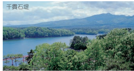
指定管理者：(有)小沢興業 TEL 0197-44-3682 090-3123-3682

焼石連峰北端に位置する駒ヶ岳の裾野に広がる扇状地に形成されている金ケ崎。駒ヶ岳の麓には広大な牧草地帯が広がります。茅葺き屋根に使用する茅も生産されています。