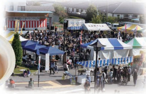
10月 金ケ崎 かねがさき オーワングランプリ