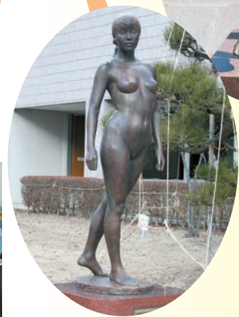
「若き立像」笹戸千津子 作 金ケ崎町立図書館前