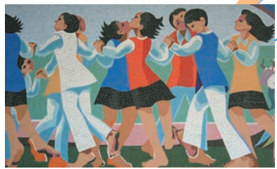
「躍動の詩」阿部盛有 作 金ケ崎小学校