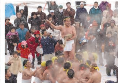
1月 永岡蘇民祭 ながおがそみんさい