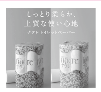
ナクレトイレットペーパー