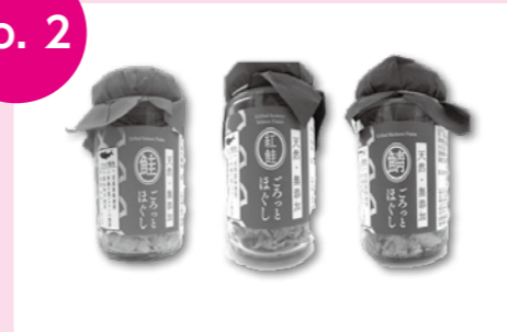
ごろっとほぐし 3 種