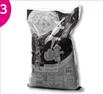
金ケ崎町産ひとめぼれ