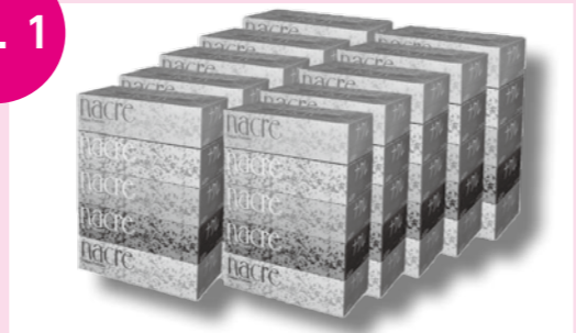
ナクレボックスティッシュ