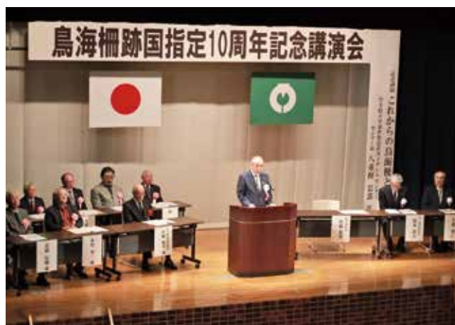
鳥海柵跡国指定 10 周年記念講演会