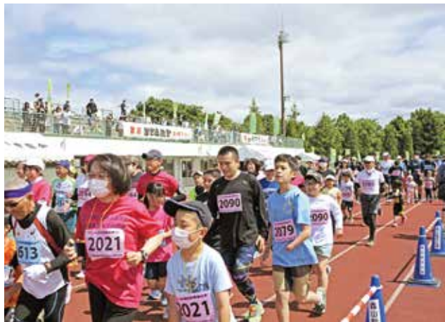
新型コロナウイルス感染症対策として参加者を県民限定で開催した第 40 回金ケ崎マラソン特別大会