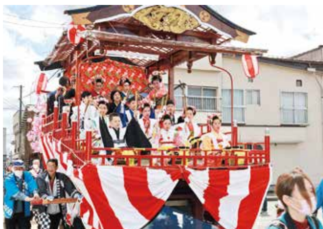
新型コロナウイルス感染症により中止していた金ケ崎火防祭が 5 年ぶりに復活し開催