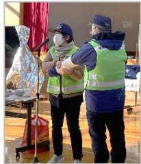
身近なものを使っての応急手当実技。