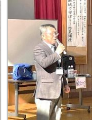
所長が、元消防士としての実体験を踏まえ総評を述べました。