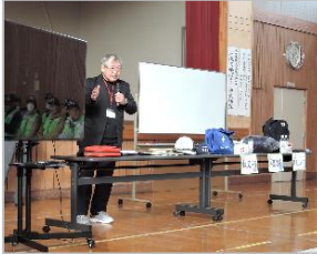
小坂倫充連合会会長が講師をつとめました。