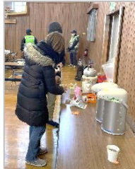
防災士の会より温かい飲み物のお振舞い。