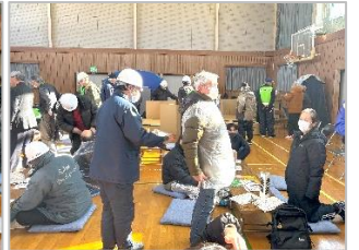
ビニール袋や新聞紙を使っての防寒対策を体験しました。