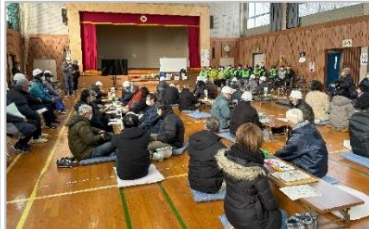
たくさんの参加者が真剣に防災について考えました。