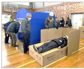
段ボールベッドやテントなど防災用品を体験しました。