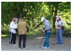
5月10日 いきいき人生塾 「グラウンド・ゴルフ大会」

北部地区のみなさまのご協力をいただきながら、無事に1年間を終えることができました。ありがとうございました!! 来年度も、みなさまの笑顔が集う場所となるよう、職員一同、精いっぱい努めてまいります。引き続き、ご指導、ご協力の程 よろしく願いいたします。また、ほくぶさんぽへのご投稿、取材のご協力もありがとうございました。