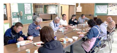
1月28日 成人講座「男の料理教室」