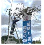
6月5日 自治会連合会 「センター 環境整備」