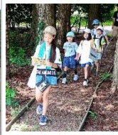
7月31日 青少年育成事業 「ほくぶクエスト」