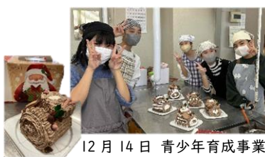
12月14日 青少年育成事業 「お菓子作り教室」