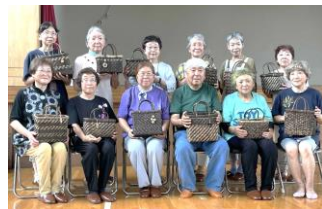
かごづくり同好会 胆江日日新聞取材