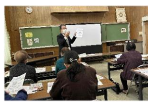
11月5日・12日 成人講座 わたしと家族の「そうぞく講座」