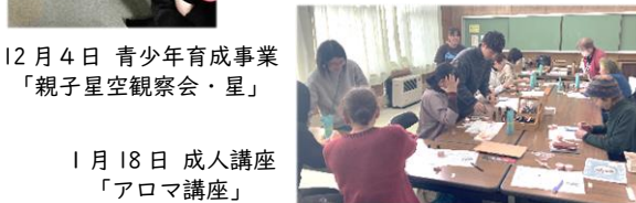
1月18日 成人講座 「アロマ講座」