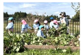
10月15日 六原幼稚園 「さつまいも掘り」