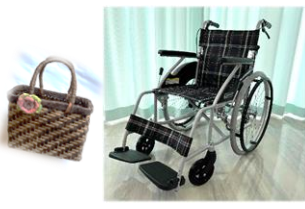
第一生命労働組合盛岡支部 車いす寄贈