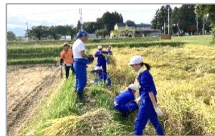
9月30日 第一小5年生 「稲刈り体験」