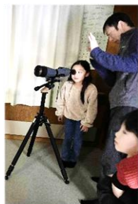
12月4日 青少年育成事業 「親子星空観察会・星」