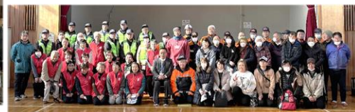
1月25日 自治会連合会主催「北部防災訓練」