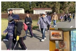
10月26日 「ほくちれんまつり」