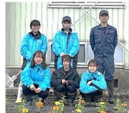
5月27・28日 農大生 「花壇花植え」