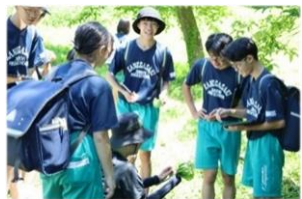
7月2日 「金中生まちあるき」