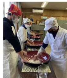
11月25日 成人講座 「そば打ち教室」