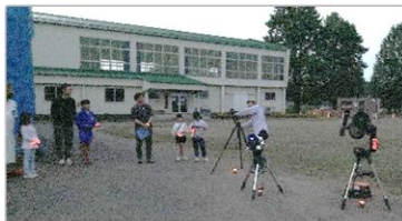
7月12日 青少年育成事業 「親子星空観察会・月」