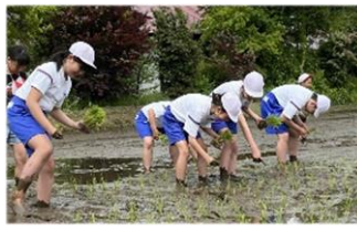
5月16日 第一小5年生 「田植え体験」