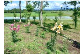
農村部墓地 ゆりの花