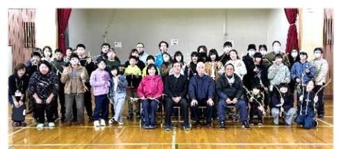
12月1日 第一小5・6年 「親子年縄づくり」