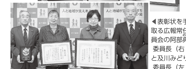
町議会議員として長年在職し功労のあった皆さん▶