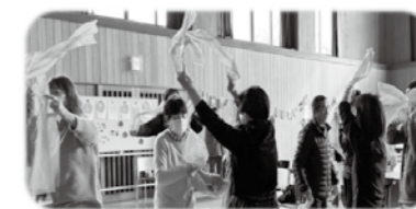
▲皆で踊った広場のダンス

これからも地域 の皆さんと楽しく つながりながら、 異文化交流を推進 してまいります。