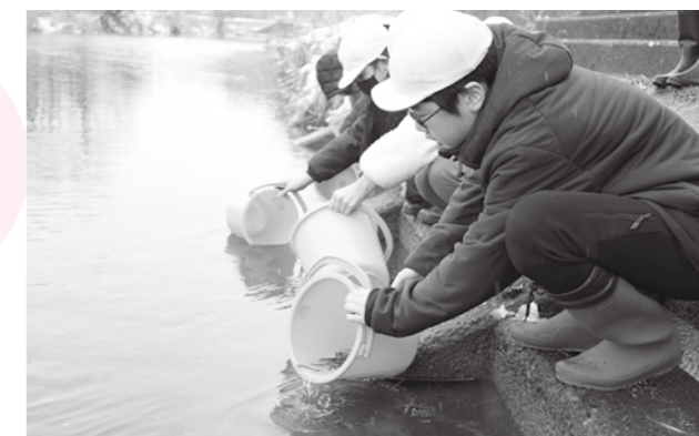
元気に戻ってくることを願い丁寧に稚魚を放流する児童たち