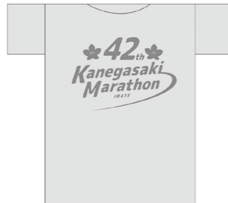
▲決定したTシャツデザイン(蛍光イエローにホットピンクの文字)

なお、第42回金ケ崎マラソン大会の申し込み締め切りは、郵便3月28日(休)、インターネット3月31日(日)です。たくさんの参加をお持ちしています。