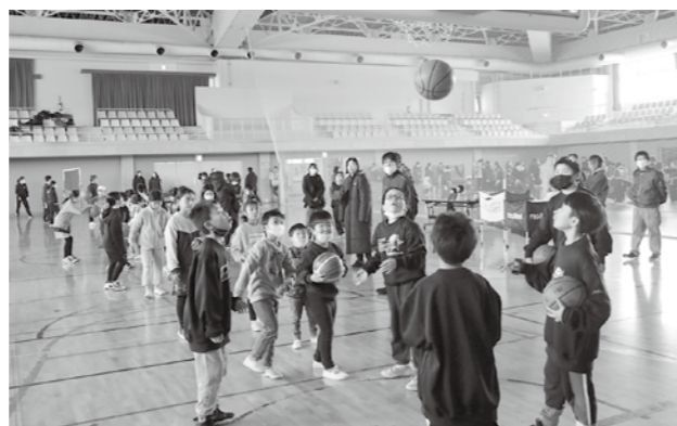
体験会では参加者が団所属の子どもたちと楽しく体験する姿が見られた