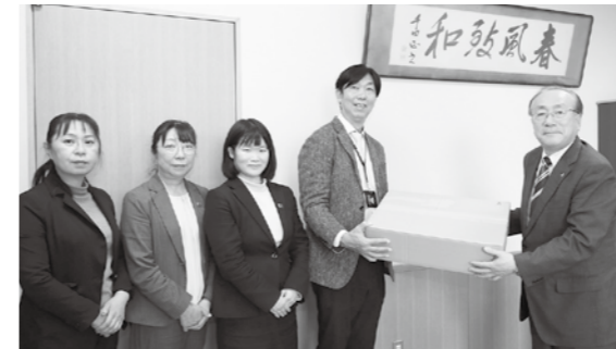
千葉教育長（右）に寄贈した奥州北営業所と奥州南営業所の皆さん