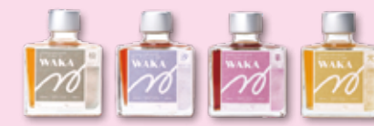
ハープリキュール和花（町内企業生産）