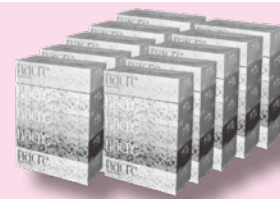
ナクレボックスティッシュ