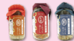
ごろっとほぐし3種