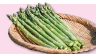
金ケ崎町産アスパラガス（季節数量限定）