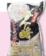
金ケ崎町産ひとめぼれ