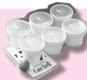
「カウベル」ジェラート

金ケ崎町の返礼品を提供して下さる事業者、電子感謝券加盟事業者を募集しています。詳細は問い合わせください。 ☎ 企画財政課ふるさと納税担当（内線 2326）