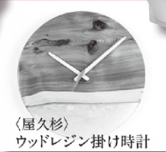
ウッドレジン掛け時計