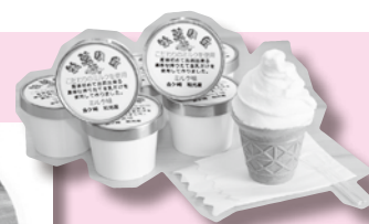
「牧草の丘」ジェラート