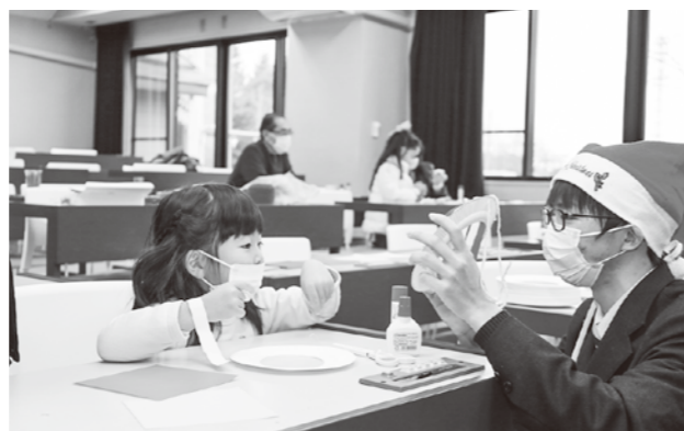
クリスマスリースの作り方を教える高校生（右）