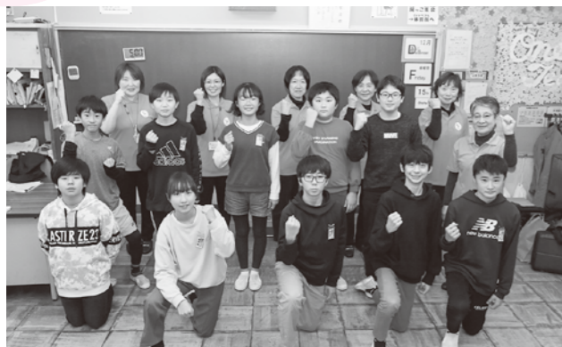
新たに認知症サポーターとなった児童たちとキャラバン・メイトら

「孫世代のための認知症講座」は12月15日、西小学校で開かれました。本年度、町内全ての小・中学校をめぐり認知症啓発を行ったキャラバン・メイトが、6年生の児童に認知症の説明や絵本の読み聞かせを実施。児童たちは、認知症の人の気持ちに寄り添うことや接し方などを考えました。