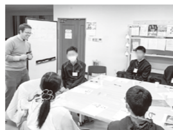
WiBでのEnglish Cafe (1月10日)

現在、金ケ崎駅東口のガラスに金高生による装飾が施されています。これは観光協会の企画を金高生に紹介したところ参加してくれたものです。中高生がいろいろなところで力を発揮できる機会も作っていききたいと思います。