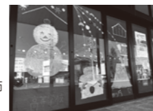
金高生による駅の装飾ぜひご覧ください!