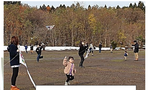
天までとどけ、私の願い