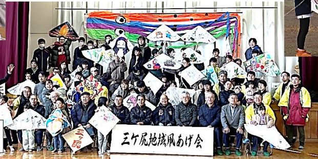
三ヶ尻地域凧あげ会