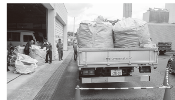
トラックに詰め込まれた大量の衣類