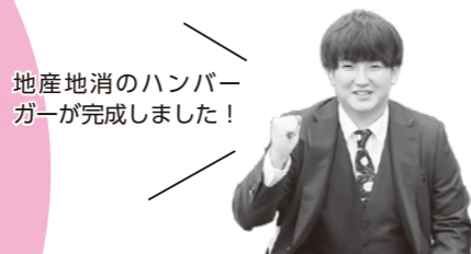
地産地消のハンバーガーが完成しました！