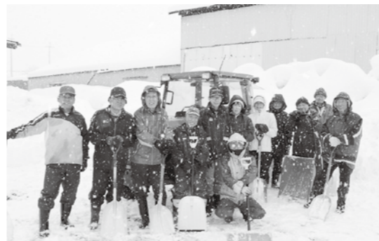
除雪作業に集まった有志の皆さん

に自治会有志16人で「東町除雪ボランティア隊」を結成しました。除雪ボランティア隊は、おもに一人暮らし高齢者、高齢者のみ世帯を対象に除排雪に取り組みんでいます。隊員各々が都合の良い時間で活動できるため、無理なく継続的に活動ができる工夫がなされています。また、地域内の農家ヘトラクターによる除雪をお願いするなど、地域住民同士の連携が図られています。