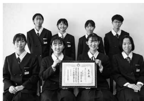
第69回岩手県中学校総合体育大会陸上競技女子総合 第3位 金ケ崎中学校 陸上競技部