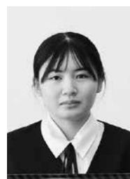
第52回岩手県中学校新人大会バレーボール競技女子の部 第3位 金ケ崎中学校 女子バレーボール部