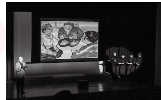
感情豊かに朗読し、観客を引き込むキャストの皆さん