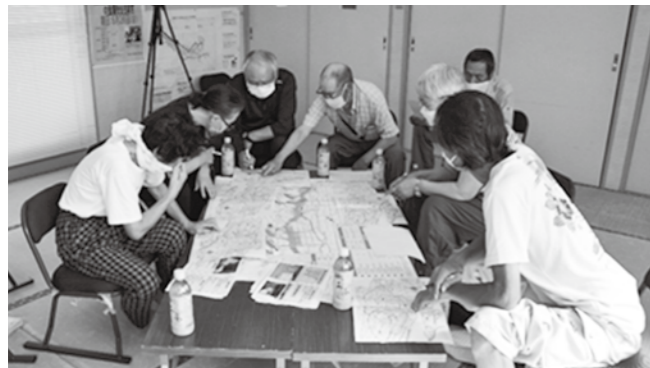
ハザードマップを見ながら避難場所や避難ルートを確認する地区民

誰かの支援を必要とする人が増える中、災害に備え、地域の人たちが準備しておくことや実際に取るべき行動について、班単位での話し合いを進めています。