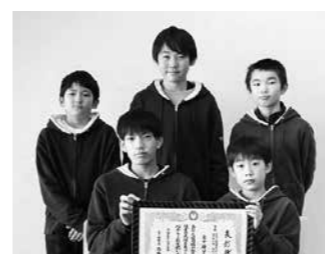
第42回全日本バレーボール小学生大会岩手県大会男子の部 準優勝 金ケ崎VBC