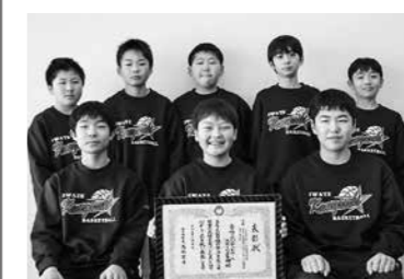
JA全農いわていわて純情米選手権第46回岩手県ミニバスケットボール交歓大会男子 第3位 金ケ崎ミニバスケットボールスポーツ少年団