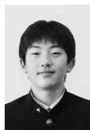
令和4年度東北中学校体育大会第52回東北中学校バレーボール大会バレーボール競技 第2位 金ケ崎中学校 男子バレーボール部