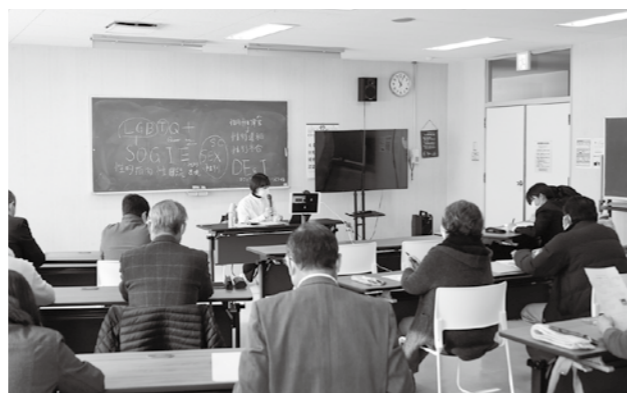
講師の話に傾きながら耳を傾ける参加者たち