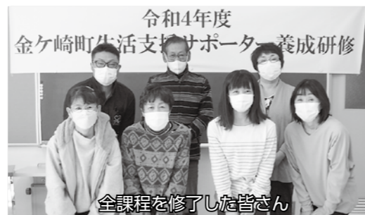
全課程を修了した皆さん

町生活支援サポーター養成研修が11月15日、22日に開かれました。町社会福祉協議会との共催で開かれた同研修は、高齢社会を地域で支える人材育成や在宅介護者の学習を目的としており、本年度で7回目になりました。