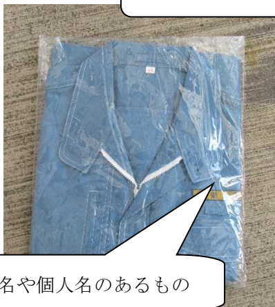
企業名や個人名のあるもの