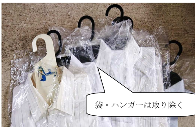
袋・ハンガーは取り除く