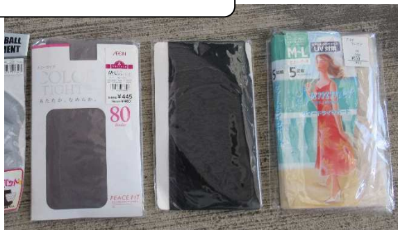
ストッキングは未使用でも回収しません