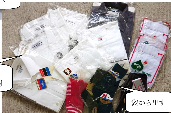
袋から出す 台紙、留めピンを取り外す