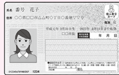
身分証明書となるマイナンバーカードの住所などは最新の状態にしてください。