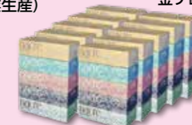
ナクレボックスティッシュ