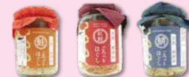
ごろっとほぐし3種 （町内企業生産）