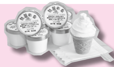
「牧草の丘」 ゼラート