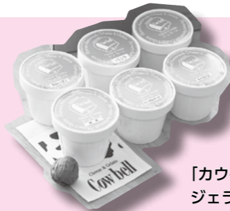
「カウベル」 ゼラート