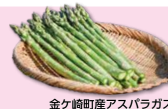
金ケ崎町産アスパラガス （季節数量限定）