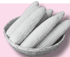
金ケ崎町産とうもろこし （季節数量限定）