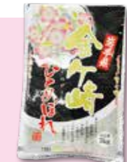
金ケ崎町産ひとめぼれ