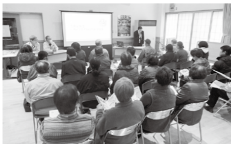
◀令和元年度に実施したごみとリサイクル地区説明会 (永岡地区生涯教育センター)