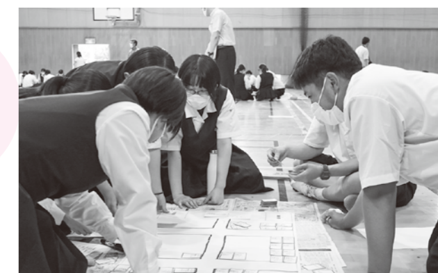
避難所運営をシミュレーションする生徒たち