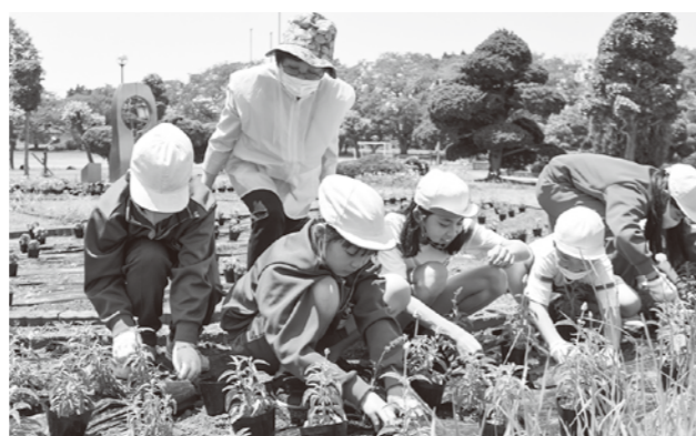
真剣に花を植える児童たち