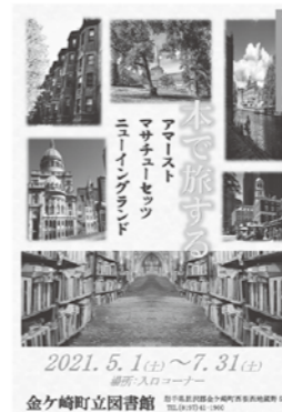
2021. 5. 1(土)～7. 31(日) 金ケ崎町立図書館

国際交流姉妹都市であるアマー・スト町とのつながりを紹介するとともに、マサチューセッツ州、ニューイングランドとの関係についての図書も展示。ゆかりの女流詩人エミリー・ディキンソンと絵本作家ターシャ・テューダーに焦点を当て二人が携わった絵本等を紹介し