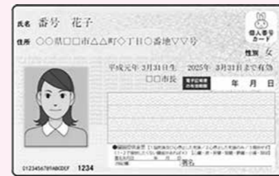
身分証明書となるマイナンバーカードの住所などは最新の状態にしてください。