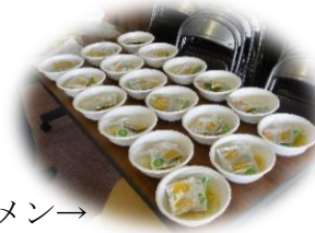
非常食のラーメン→