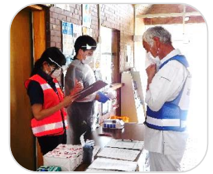
まずは検温・問診から