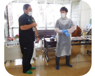
職員は防護服？を着用