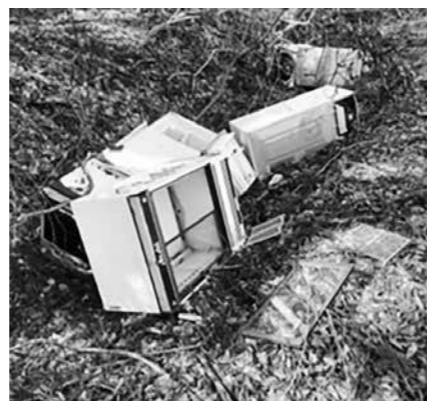
町内の不法投棄現場