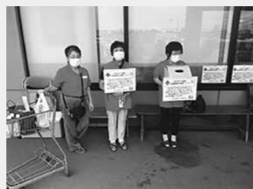
ビッグハウス金ケ崎店での募金活動の様子（8月8日）