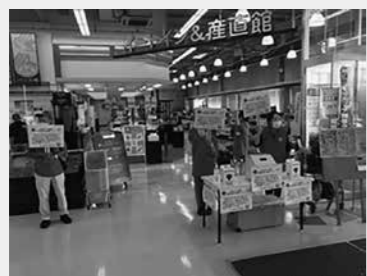
イオンスーパーセンター金ケ崎店での募金活動の様子（8月4日）