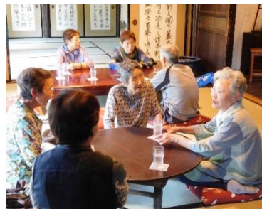
お昼をいただきました♪