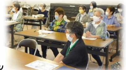
会議室で講話を聞きました