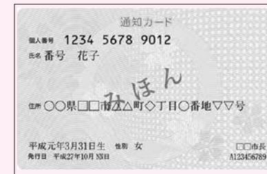
マイナンバーの通知カード

住民の皆さまに送付している「通知カード」は、令和元年5月31日から1年以内で政令で定める日以降、廃止になります。廃止されると、住所変更の手続きはできなくなります。「通知カード」の住所変更は、廃止前に行ってください。 問 住民課 (内線 2127)