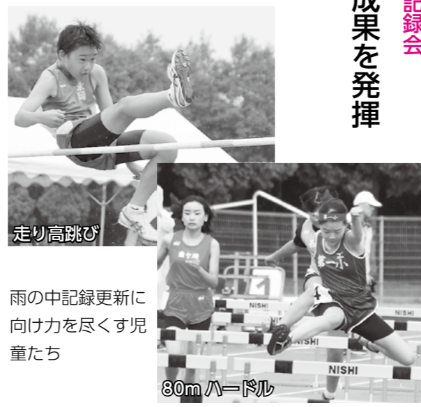
雨の中記録更新に向け力を尽くす児童たち