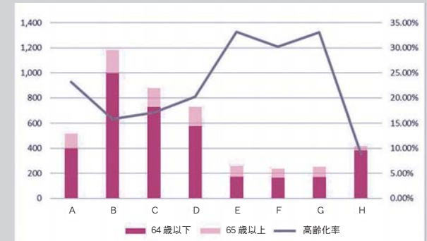
■ある地区の行政区ごとの人口と高齢化率