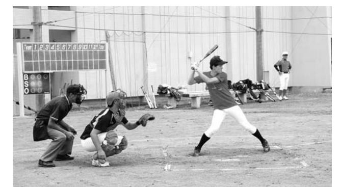
競技に汗を流す選手たち(軟式野球)

町民スポーツ大会は9月2日、町文化体育館などを会場に行われました。町内6地区から約650人が参加しスポーツを通じて地域住民の交流を深めました。競技は▽軟式野球▽卓球▽ゲートボール▽ビーチボール▽バレー▽スローピッチソフトボール▽グラウンドゴルフ▽ビーチボールの7種目が行われました。競技結果は南方地区が連覇を達成し、2位に三ヶ尻地区、3位に北部地区となりました。