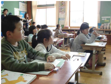
2年生 国語「ふきのとう」