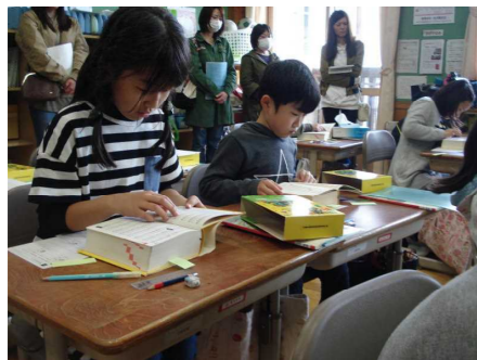
4年生 国語「漢字辞典の使い方」

その後、行われた「平成29年度PTA総会」では、平成28年度の活動・決算の承認及び、今年度の事業計画・予算等についての承認をいただきました。また、平成29年度の新役員も決まりましたので併せてお知らせします。1年間どうぞよろしくお願いいたします。