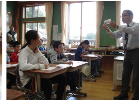
6年生 社会「日本の歴史」