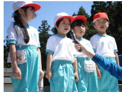
1年生「はじめの言葉」