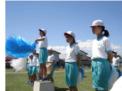
応援合戦「エール交換」