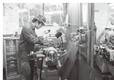
地域産業の担い手

問 ものづくりに携わる既存中小企業、小規模事業者をどのように考えているか。 町長 国内のものづくり産業を支えているのは、中小企業、小規模事業者である。町内においても、目まぐるしく変化する社会経済や雇用情勢に対応しながら懸命に操業している。行政と事業者との情報交換や連携は、商工会を窓口として対応している。 問 ILCをはじめとする未来創造産業への参入を視野に入れ、チャレンジする事業者への応援が必要ではないか。 町長 地元企業が先端技術産業に挑戦できるよう、県と連携しながら応援施策を検討していく。現状の中小企業、小規模事業者への支援は、