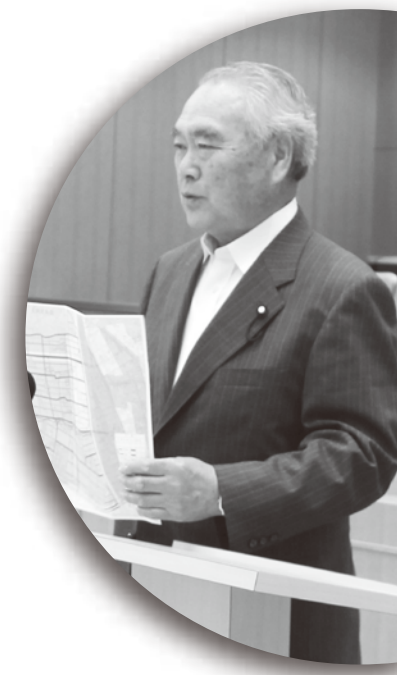
ちだ つとむ 議員 千田 力 CHIDA TUTOMU

農林課長 国の主管省が異なるので規制がある。農林関係の補助で難しいとの回答があったが、引き続き農政局を通り要望しよう。