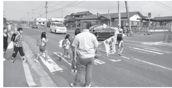
やさしい見守りの目をむけるスクールガード

スクールガードはポランティアで 5 校 175 人いる。子どもたちの登下校時の安全確保に協力してもらっている。スクールガードリーダーは町内で 1 人を委嘱している。交通安全のための指導をしている。