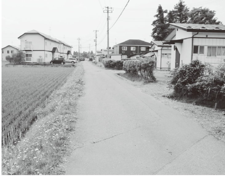
せまい町道 早く拡幅を

町長 要綱施行後10年間で開発されたのは23件である。半分以上は3〜4mの町道沿いが開発されており、歩道付き道路を整備したからといって、必ずしも開発が進むわけではない。この地区は指定後、幹線道路を優先して整備してきた。今後は休止中の路線整備に加え、安全面から既存道路の長寿命化対策など維