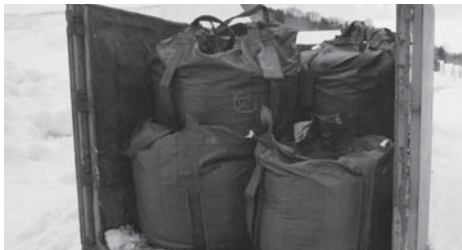
焼却を待つ牧草ペレットの入ったフレコン

Q 国からの補助はない。 A 売却した土地はどこか。その面積は。 Q 旧赤門児童館跡地の一部で、770㎡を宅地として売却した。 A 宅地までの取付道路分も含むのか。 A 含まれている。 ※町道荒巻・東町線整備事業にかかる移転者の代替地の売却金と町有地の売却による収入です。