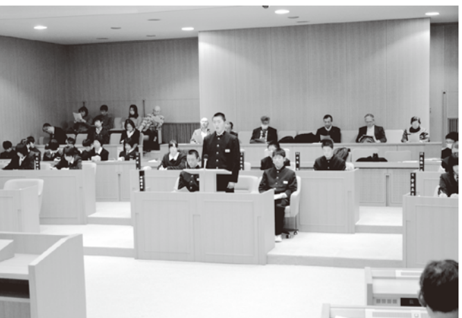
若い感性で質問する議員(中学生議会)