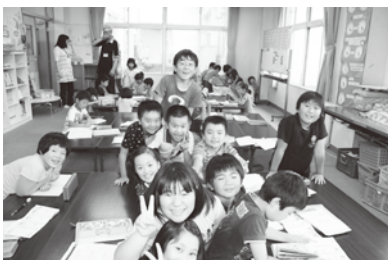
金ヶ崎小学校の学童保育所(福祉センター)

問 北部学童保育所があまりにも狭いので、一般質問、議案審議で「遊び場(プレイルーム)」増設を要望してきた。その検討状況はどうなっているか。 町長 増築の場合は補助対象額が低く、現在の財政状況では困難である。