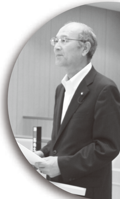
山路正悟 議員 YAMAJI SYOGO