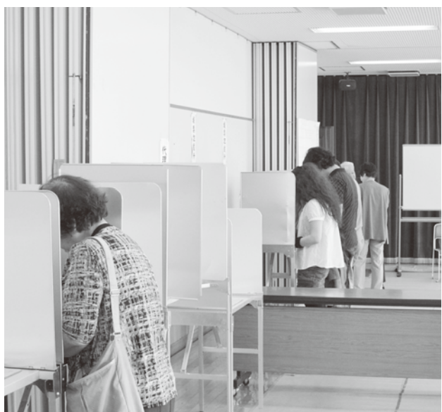
町の将来のため 真剣に選ぶ有権者

商工会へ丸投げの印象を受ける。町として、工業振興の推進方針、推進プログラムを策定し、広く関係団体・関係者へ示すべきではないか。 町長 今まで、中小企業、小規模事業者の育成という視点での対応が少なかった。将来的なビジョンの策定を前向きに検討したい。