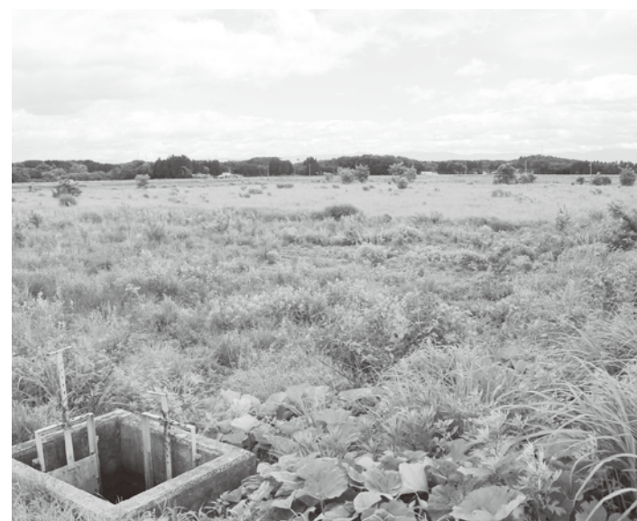
原野と化した農地

問 元気農業について、地域農業マスタープラン、多目的機能支払制度、農業者応援イベント等で支援を行う。また、元気農業プロジェクトや特産品ブランド化プロジェクトを推進し、アスパラ生産県内一を目指す方針演述で述べている。しかし町は米生産者世帯が多くを占めており、今後は減反奨励金の削減やTPP問題、高齢化、後継者不足、低所得等で農家離れが懸念される。そこで農業協同組合等、県南広域振興局行政と農法人の代表者で組織を作り、6地域に適した作物や今後の農家経営について、異業者との連携で6次産業化の参入の検討をすべ 町長 国内の農業をめぐる情勢は非常に厳しい。耕作放棄地、担い手不足、高齢化、TPP交渉など課題が生じている。平成25年12月新たな農業政策で足腰の強い農業、多目的機能の維持、活気を図るための施策の推進、課題の解決に取り組んで行く。金ヶ崎農業を確立するため、町地域農業推進本部を26年2月に発足させ、関係機関と検討している。現状では農業者は減少し農地の保全が危ぶまれる。農地中間管理機構などの制度を活用し、集落営農や法人化の取り組みをさらに進め、集落内の農地集積