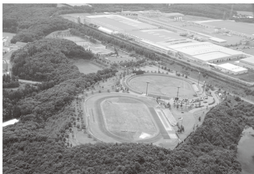
森山総合公園(中央)とトヨタ自動車東日本(株)岩手工場(上右)

問 町はアメリカのアマースト町、中国の長春市、ドイツのライネフェルデ・ヴォアピス市の外国3市町と姉妹都市関係にある。今年度から始まった小学校での英語授業、毎年継続している中学生の海外派遣等アマースト町との国際交流は整合性がとれているが、他に