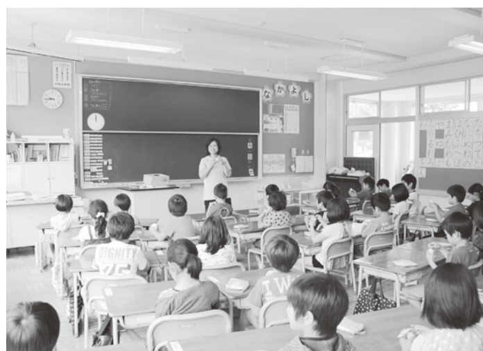
どの子ども のびのび 健やかに