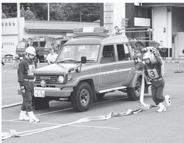
地域の守り手消防団 年々装備は充実

Q 小型積載車、ポンプ自動車の配備はどのようにして決めるのか。 A 各分団の地域性や、分団内の配備車輛の実態などを考慮し、消防団幹部や消防委員と協議、検討の上決定する。 Q 消防ポンプ自動車に変更する理由。 A 町の消防整備計画において、各分団1台〜3台の消防ポンプ自動車を配備する方針に基づき実施するもの。