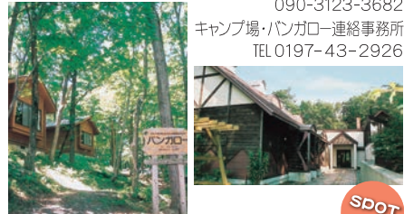
キャンプ場・バンガロー連絡事務所 TEL 0197-43-2926

SPOT 9 千貫石森林公園 広大な自然の中に整備されたこの公園は、豊かな水をたたく二つの堤とその周辺の樹林や奥羽山系により四季折々に絶景を見せてくれる癒しの場でもあり、公園内には林間歩道8コース、キャンプ場やバンガローなどの施設があり、アウトドアを楽しむ場にもなっています。