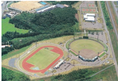
金ケ崎町西根森山31-2 TEL 0197-44-5600

温水プール、アスレチックジム、エアロピクス、スカッシュ、ラケットボール、サウナなどの屋内施設と陸上競技場、野球場、テニスコートを完備した総合施設です。