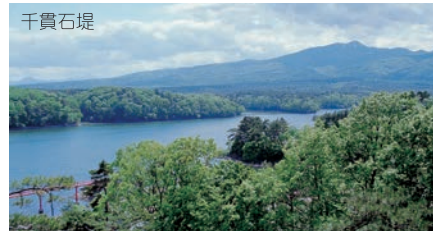
千貫石堤 指定管理者：(有)小沢興業 TEL 0197-44-3682 090-3123-3682

焼石連峰北端に位置する駒ヶ岳の裾野に広がる扇状地に形成されている金ケ崎。駒ヶ岳の麓には広大な牧草地帯が広がります。茅葺き屋根に使用する茅も生産されています。