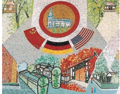
「未来からの呼び声、ガーデンシティ金ケ崎」 阿部盛有 作 金ケ崎駅舎内

金ケ崎町では、さまざまな場所にモニュメントや壁画などの芸術作品を展示しています。ぜひ探してみてください！