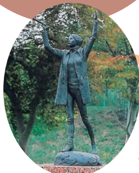
「雪娘」佐藤忠良 作 森山総合公園内