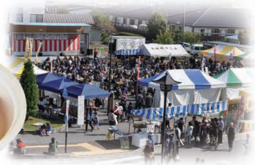
10月 かねがさき オーワングランプリ