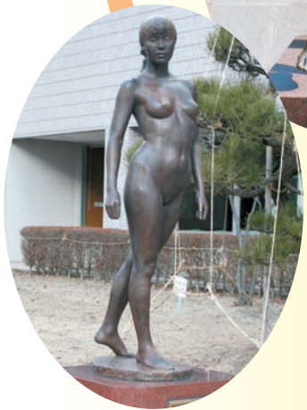
「若き立像」笹戸千津子 作 金ケ崎町立図書館前