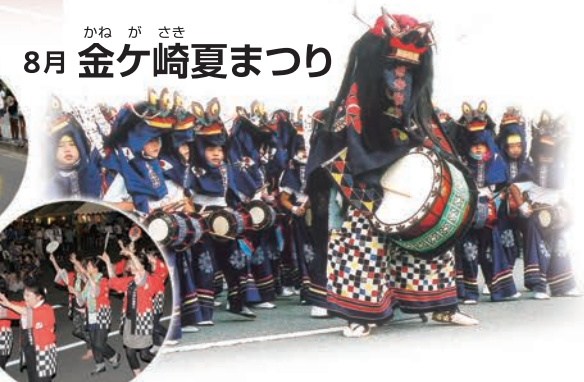
かねがさき 8月 金ケ崎夏まつり