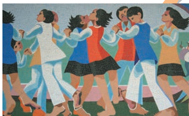
「躍動の詩」阿部盛有 作 金ケ崎小学校