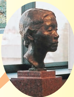
「母の顔」佐藤忠良 作 金ケ崎駅舎内