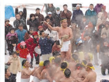
1月 ながおがそみんさい 永岡蘇民祭