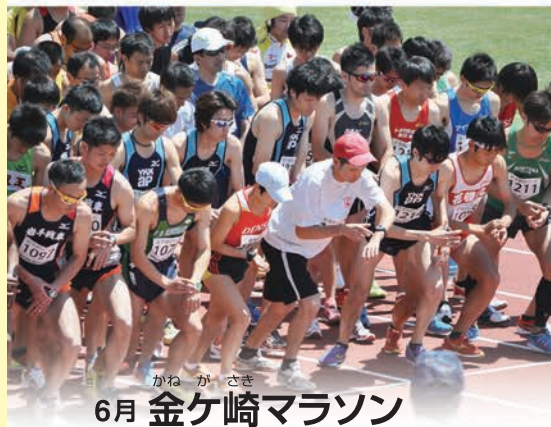
かねがさき 6月 金ケ崎マラソン

祭りは、1月の「永岡蘇民祭」、8月の「金ケ崎夏まつり」と「農業まつり&米の日」、10月の「金ケ崎オーワングランプリ」があります。スポーツ行事は、6月の「金ケ崎マラソン」、8月の「むかでマラソン(1km・仮装など)」、11月の「町内一周駅伝競走大会」などがあります。