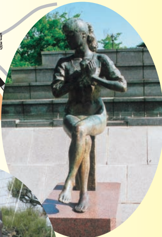
「シャップラウス」 笹戸千津子 作 金ケ崎町役場前