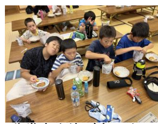
非常食を皆で食べました