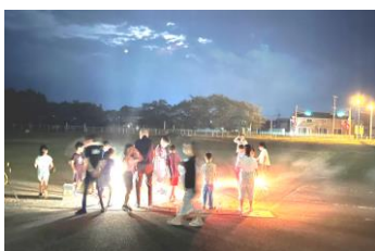
夜のお楽しみ花火～