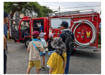
屯所の見学もさせていただきました