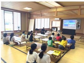
防災について学習

7月31日(月)～8月1日(火)、街地区の小学生を対象に1泊2日で防災について学び、街地区の避難所でもある街地区センターに宿泊しました。防災についての座学、街地区の危険箇所ウォークラリー、給水車水汲み体験、非常食を食べる、放水訓練等盛り沢山の内容でした。おうちの人と離れて友達と一晩過ごしたことは、きっと大きくなって記憶に残ることでしょう。参加してくれた子ども達にとって良い夏の思い出になっていればいいなあと思っています。また、本事業では町消防団第1分団第1部の皆様には多大なるご協力を頂きました。ありがとうございました!