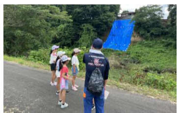
危険箇所ウォークラリー