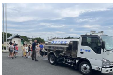
給水車で水汲み体験