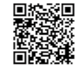
町ホームページ (対象者③④)

町は、食費等の物価高騰により特に影響を受ける低所得の子育て世帯を支援するため、給付金を支給します。 ■ 対象者 令和5年3月31日時点で18歳未満(特別児童扶養手当の対象児童は20歳未満)の児童を養育する父母等で、次のいずれかに該当する人(申請不要で本給付金を既に受け取った人を除く) ①住民税非課税(令和5年度分)のひとり親世帯以外の人 ②令和5年1月1日以降の収入が減少し、住民税非課税相当の収入となったひとり親世帯以外の人 ③公的年金等を受給しており、令和5年3月分の児童扶養手当を受けておらず、令和3年の収入が児童扶養手当受給者と同水準の収入のひとり親の人 ④令和5年1月1日以降の収入が減少し、児童扶養手当受給者と同水準の収入となったひとり親の人 ■ 助成額 対象児童1人につき5万円 申請書や必要書類は、町ホームページで確認いただくか、子育て支援課に問い合わせください。