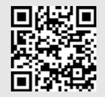
二次元バーコード