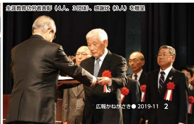
生涯教育功労者表彰(4人、3団体)、感謝状(3人)を贈呈