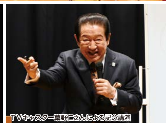
TVキャスター草野仁さんによる記念講演