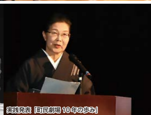
実践発表「町民劇場10年の歩み」