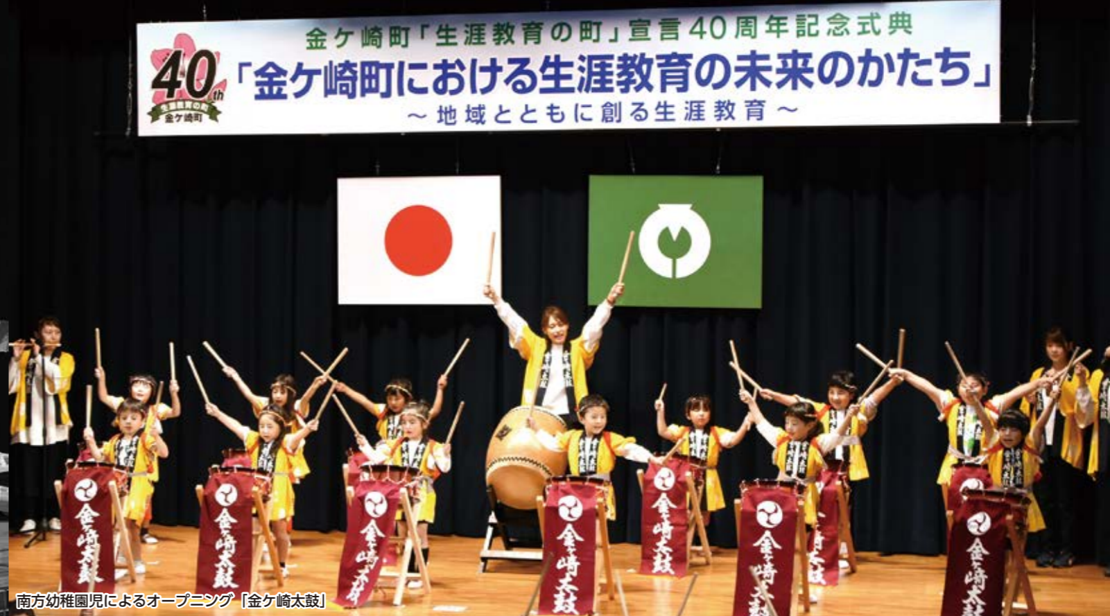
南方幼稚園児によるオープニング「金ケ崎太鼓」