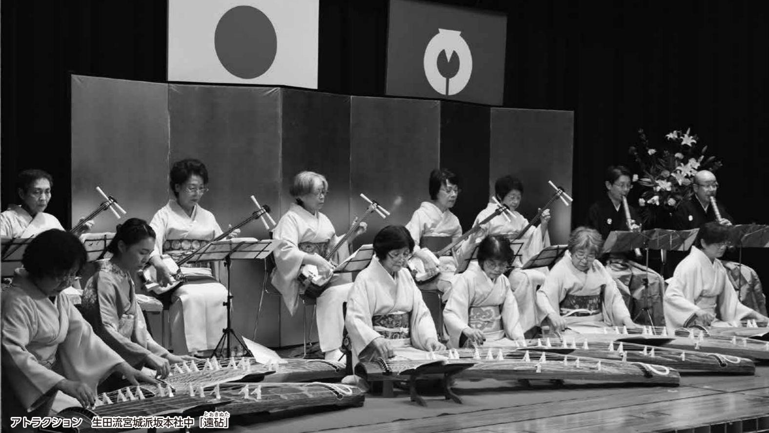
アトラクション 生田流宮城派坂本社中「遠鼓」