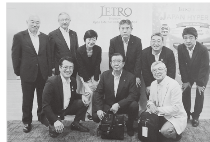
日本貿易振興機構シンガポール事務所を訪れた訪問団

センターが置かれた38段の棚が備え付けられ、水を動力として棚を上下に稼働。水はシステム内で再利用され、最終的には野菜の水に利用されます。各タワーの消費電力は1日当たりわずか60ワット、電球1個と同程度の消費電力となっていました。このシステムでは従来の土の農地に比べ10倍もの収穫量がありますが、設備投資額と販売額とのギャップに日本では難しいと感じたところでした。