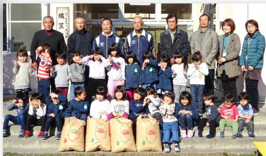
☆折笠保育園年少組の子供たちと☆