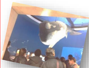
☆巨大なマッコウクジラの骨格標本にびっくり!! でっけえ〜!! ☆

また、今年度から金ヶ崎米のおいしさを実感してもらいたいとの思いから、折笠保育園へ給食用にお米を90kg贈呈しました。可愛い園児たちからお礼の言葉をもらい、微笑ましいひと時を過ごしてきました。