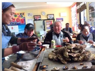
☆お屋のカキ小屋と海鮮御膳! 2コースに分かれ海の幸を堪能しました☆