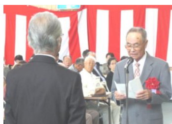
街地区老人クラブ千葉連合会長の感謝の言葉