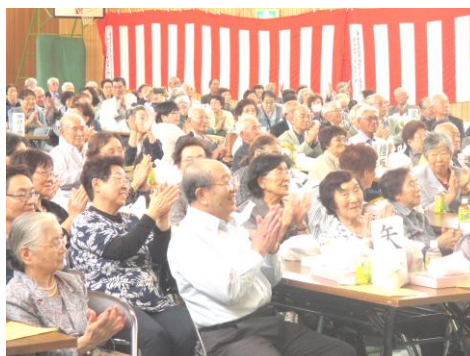
アトラクションを楽しむ皆さん