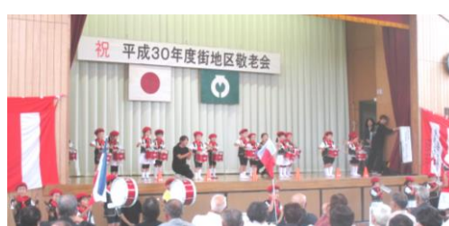
アトラクションのオープニングを飾ったたいよう保育園児