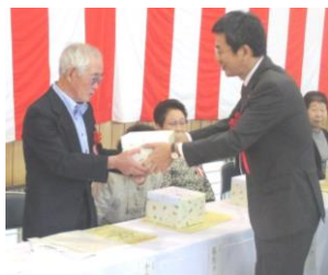
副町長より記念品を受け取る米寿者