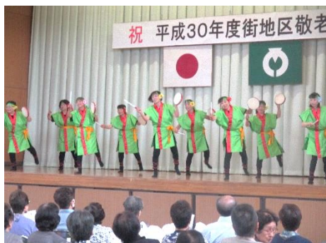
各自治会によるアトラクション(写真は町上)